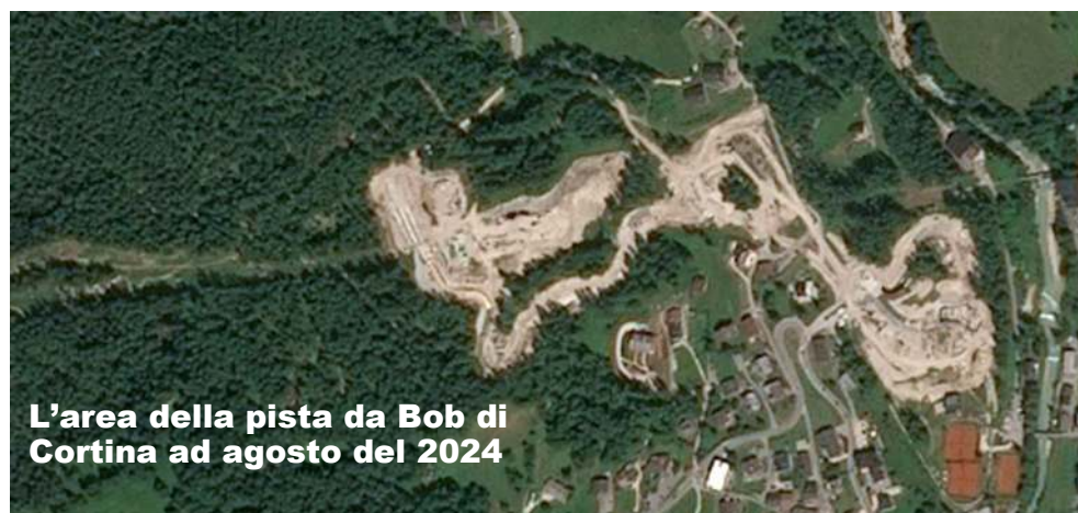
L'area della pista da Bob di Cortina ad agosto del 2024

Un ragionamento serio sulla sostenibilità e sul futuro delle Olimpiadi dovrebbe tenere in considerazione il riscaldamento globale che renderà inutilizzabili le infrastrutture e gli impianti sciistici, facendoli diventare obsoleti ancor prima di essere terminati. Sarebbe opportuno vagliare la proposta, logica e facilmente attuabile, di fare, delle Olimpiadi, un evento dislocato, in cui ciascun Paese ospita le competizioni per cui è più equipaggiato, nel momento in cui il clima è più adeguato.