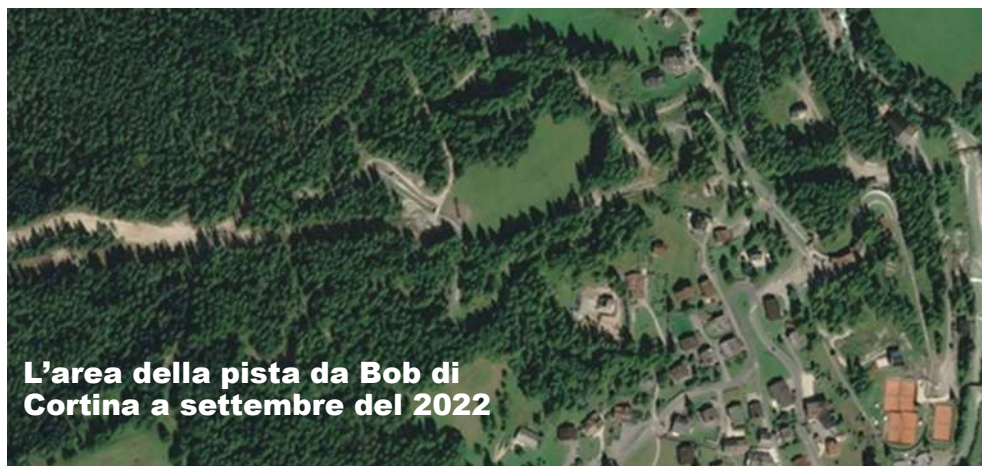
L'area della pista da Bob di Cortina a settembre del 2022